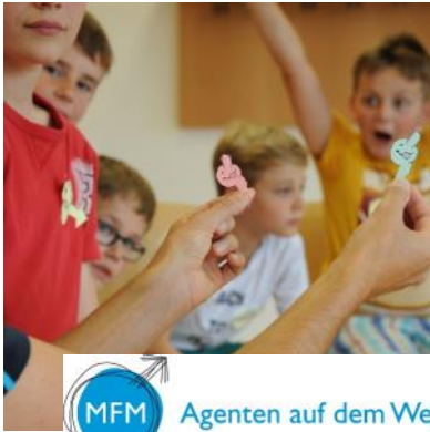
MFM Agenten auf dem Weg My Fertility Matters