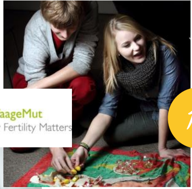
MFM WaageMut My Fertility Matters