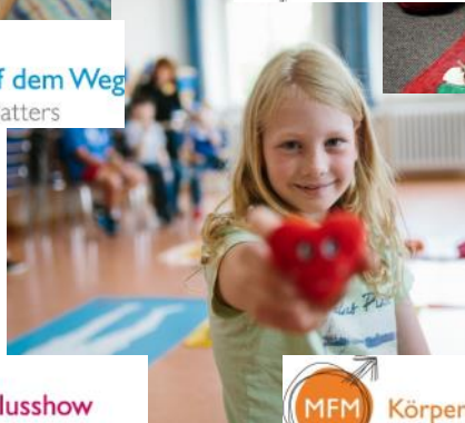
MFM Zyklusshow My Fertility Matters