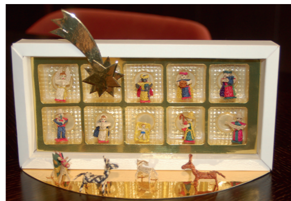
Mexikanische Strohkippe präsentiert in einer Pralinschachtel