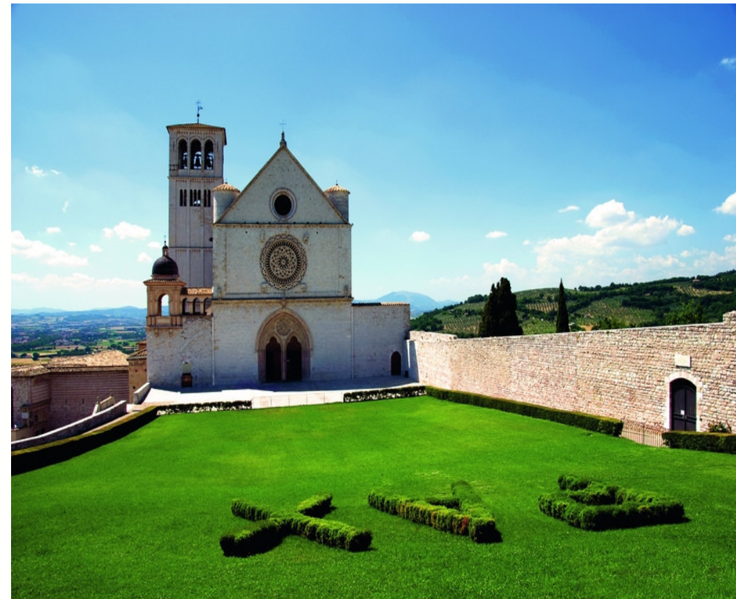
Weltbekannt: Die Franziskusbasilika

Die beigefügten Allgemeinen Reisebedingungen sind Bestandteil dieses Prospektes.