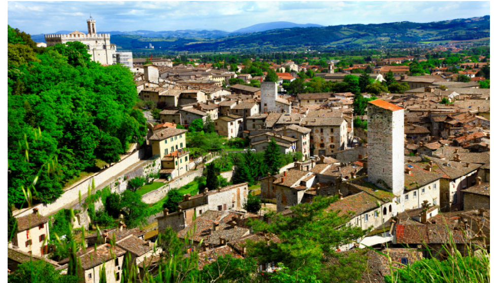
Blick auf Gubbio

Am Vormittag fahren wir nach Fonte Colombo – Mittagsaufenthalt. Im herrlich gelegenen Kloster Greccio stellte der hl. Franziskus in der Felsgrube die Geburt Jesu als „lebende Krippe“ nach, um der Bevölkerung die Weihnachtsgeschichte zu veranschaulichen. Von der Terrasse bietet sich ein grandioser Blick über das Rietital. Am Abend Rückkehr nach Assisi.